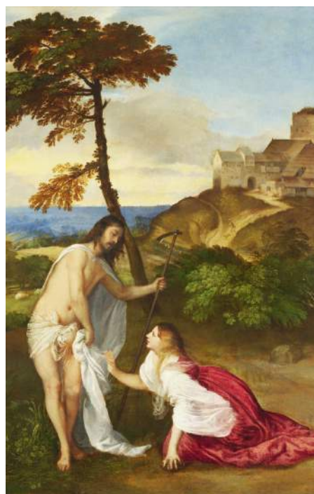
Afb. 13) Titiaan, Noli me tangere , 1511, Londen, National Gallery