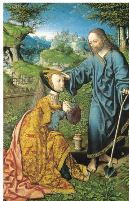
Afb. 14) Jacob Cornelisz. van Oostsanen, Noli me tangere , 1507, Kassel, Staatliche Museen

Alsof hij zeggen wil: Ja, loslaten doet pijn (in het verhaal staat niet zozeer 'raak me niet aan' als wel 'houd me niet vast'). Maar ik zal bij je blijven, als je trooster.