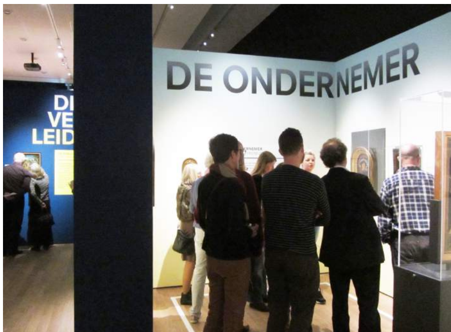
Afb. 17) Rondleiding met leden van de stichting door de tentoonstelling in het Stedelijk Museum Alkmaar.