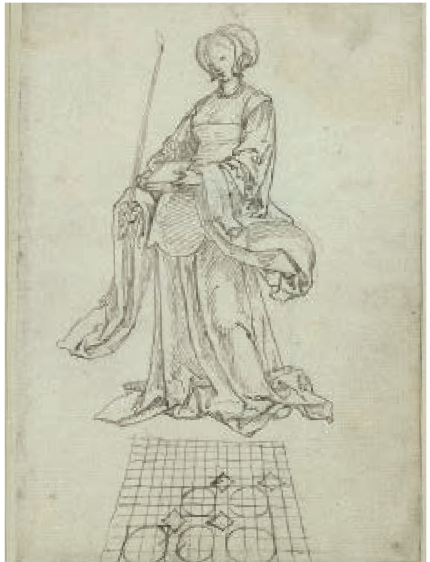
Schetsboek uit het atelier van Jacob Cornelisz., fol. 25r

De schetsboek-uitgave zal tijdens de tentoonstelling in de museumwinkels verkrijgbaar zijn. De publicatie krijgt een aantrekkelijke uitvoering, met twee boekjes in een cassette, op de exacte grootte van het originele schetsboekje. Het ene deel bevat een getrouwe reproductie van alle bladen, in het andere deel staan inleidende teksten door Ilona van Tuinen en Daantje Meuwissen en een beknopte toelichting per blad door Ilona van Tuinen. Beide deeltjes worden geheel in kleur gedrukt, door drukkerij Van Wijk uit Oostzaan. De precieze verkoopprijs is nog niet bekend, maar deze zal in elk geval onder de € 20 liggen. Zo willen we het boekje voor zo veel mogelijk geïnteresseerden toegankelijk maken. De tentoonstelling en de publicatie van het schetsboek beloven twee ongekende hoogtepunten te worden in het bestaan van